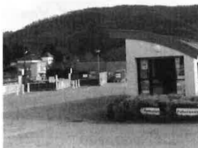
Déchetterie de Villefranche ZI des Gravasses 12 200 Villefranche de R

Horaires d'ouverture : du Lundi au Samedi de 9h00 à 12h00 et de 14h00 à 18h00