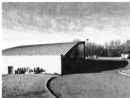
Déchetterie de Villeneuve ZA des Grèzes 12 260 Villeneuve

Horaires d'ouverture : Lundi de 14h00 à 18h00 Mardi/Mercredi/Jeudi/Vendredi de 9h00 à 12h00 et de 14h00 à 17h00 Samedi de 8h00 à 13h00