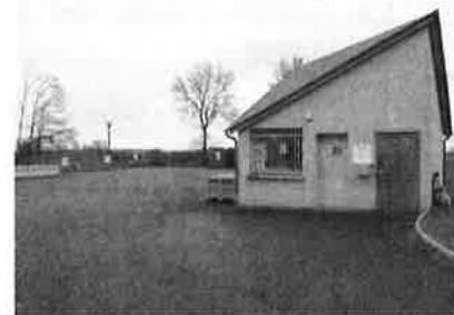
Déchetterie de La Fouillade ZA des Crémades 12 270 La Fouillade

Horaires d'ouverture : du Mardi au Vendredi de 14h00 à 18h00 et le Samedi de 10h00 à 12h00 et de 14h00 à 18h00