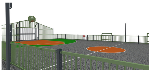
Visuels City stade